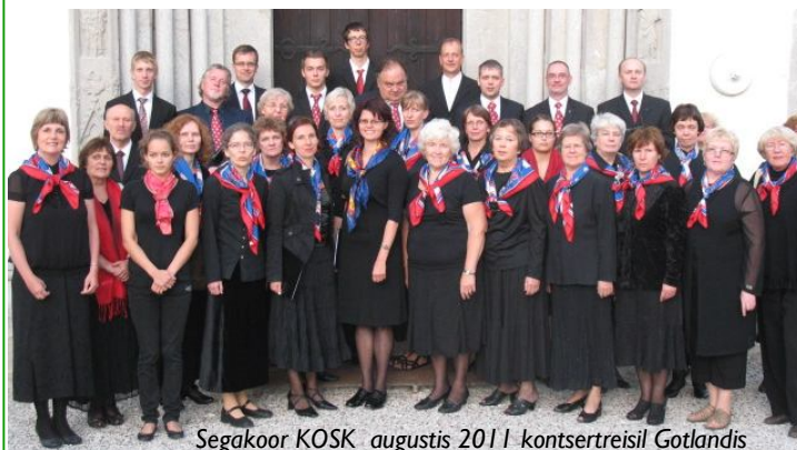
Segakoor KOSK augustis 2011 kontsertreisil Gotlandis

16. oktoobri jumalateenistusel ja sellele järgneval kontserdil saab kuulata Viljandi Jaani kirikus eesti heliloojate vaimulikku muusikat, mis on ilmunud aastatel 2010 ja 2011. Kontserdiks valmistutakse päev varem Tartus, kus toimub EELK Kirikumuusika Liidu korraldatav õppepäev, mille sihtgrupiks on Lõuna-Eesti