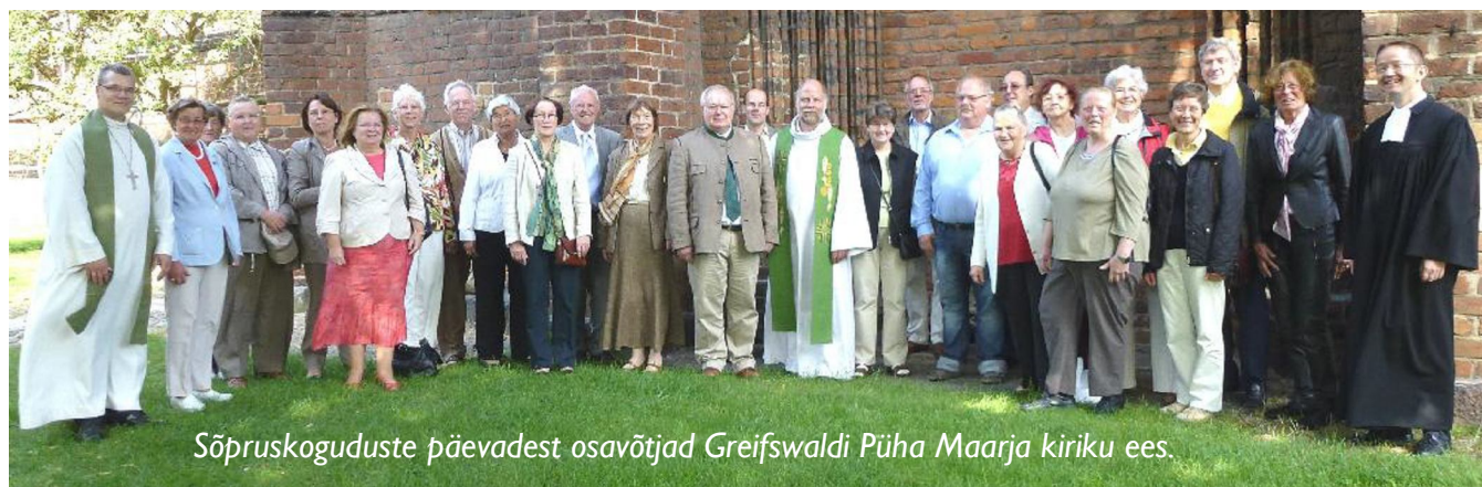
Sõpruskoguduste päevadest osavõtjad Greifswaldi Püha Maarja kiriku ees.

Laupäeva pärastlõunal kogunesime Püha Maarja koguduse pastoraati, kus leidsid aset mõttetalgud. Tänavuste sõpruskoguduste päevade teemaks oli ARMULAUD. Osavõtjad jagunesid rühmadesse, kus toimus arutelu armulauaga seotud arusaamade ja praktikate üle meie kirikutes. Olime selle teema ning püstitatud küsimustega teinud ka kodutööd. Hariv ja põnev oli teada saada, millised on näiteks armulaua jagamise viisid sõpruskogudustes (ühisest karikast joomine, armulaualeiva karikasse kastmine, viinamarjamahla kasutamine lisaks veinile), kui sageli pühitsetakse armulauda, kas ja kuidas osalevad koguduseliikmed armulaua jagamisel jne.